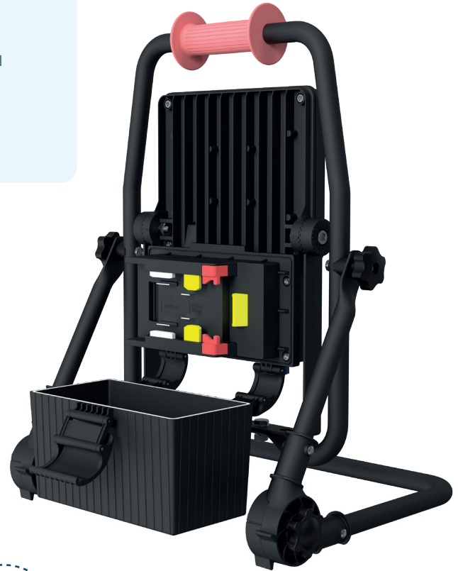
Nieuw! Klasse II Multi Battery